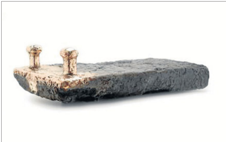
Obra escultórica de Monserrate. MONSERRATE