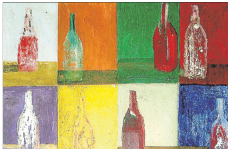
Una de las obras de 'Ampolles de color'.